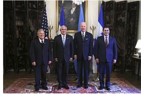
Previo a la presentación del Plan, los mandatarios sostuvieron una reunión con el vicepresidente estadounidense. Joe Biden.

“Nuestro compromiso (es) por seguir impulsando estas iniciativas regionales y enfrentar como bloque unido, y con fuerza, los retos que afrontamos”, concluyó.