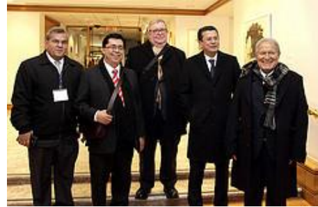
La delegación presidencial estuvo compuesta por titulares de distintas carteras de Estado.