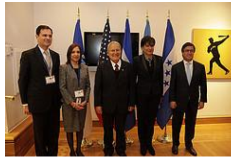
Los presidentes se reunieron con la Secretaria de Comercio de Estados Unidos, Penny Pritzker.