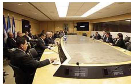
El presidente Sánchez Cerén conversó con importantes empresarios estadounidenses y de la región centroamericana.